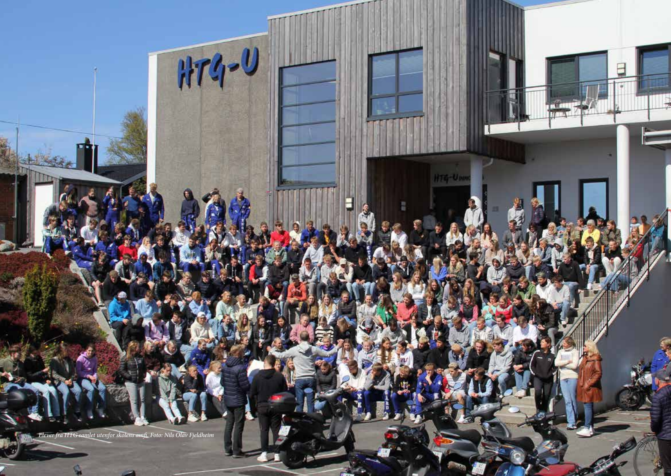
Elever fra HTG samlet utenfor skolens amfi.