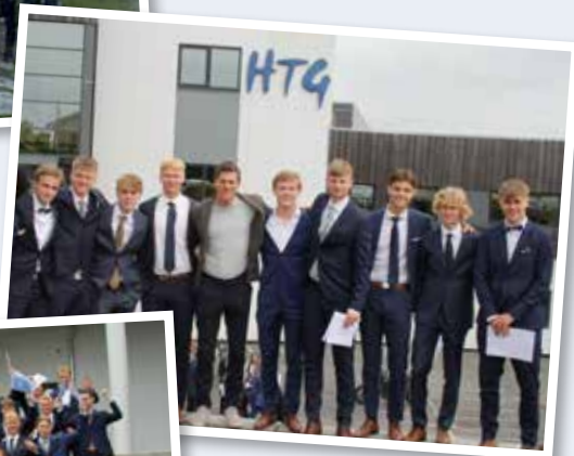
Skoleavslutning for VG3.