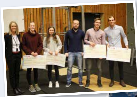
Juleavslutning med utdeling av idrettsstipend.