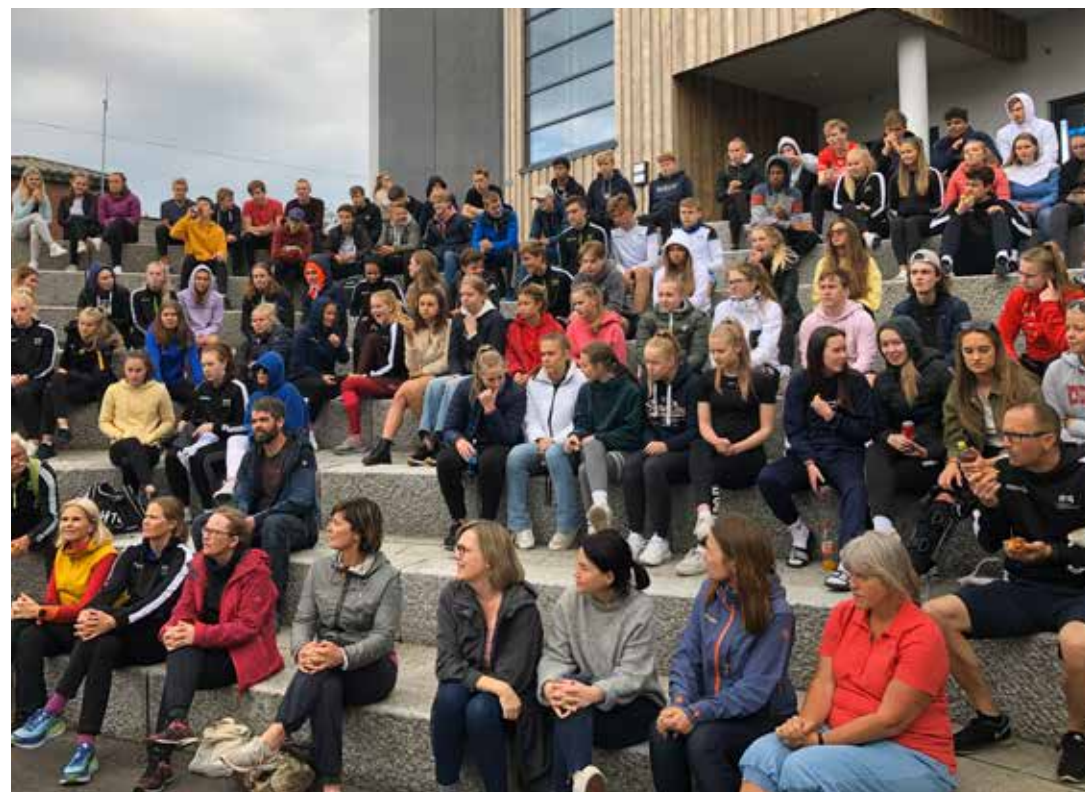
Sommeravslutning i atriumet.