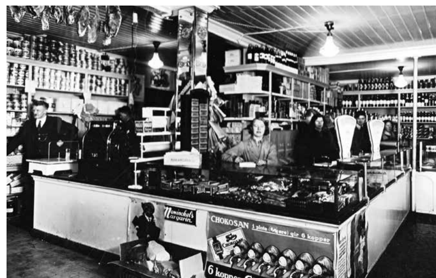
Haugesund hadde mange handelsborgere i forhold til innbyggertallet. Her ser vi fra butikken Haugesund Colonialforretning også kjent under navnet «Amundsen på hjørna».

I forhold til antall innbyggere var det ingen byer som hadde flere handelsborgere enn Haugesund. I 1929 hadde Haugesund et folketall på 17.100 hvorav 506 var handelsborgere, det vil si én handelsborger for hver 33 innbygger. Til sammenligning var det på samme tid 50 innbyggere pr handelsdrivende i Oslo og 37 i Trondheim. I tillegg til mange handelsborgere hadde byen et rikt og variert næringsliv med rederier, banker, forsikring og industri. Det var derfor stort behov for personer med kunnskap innen bokføring og handelslære.