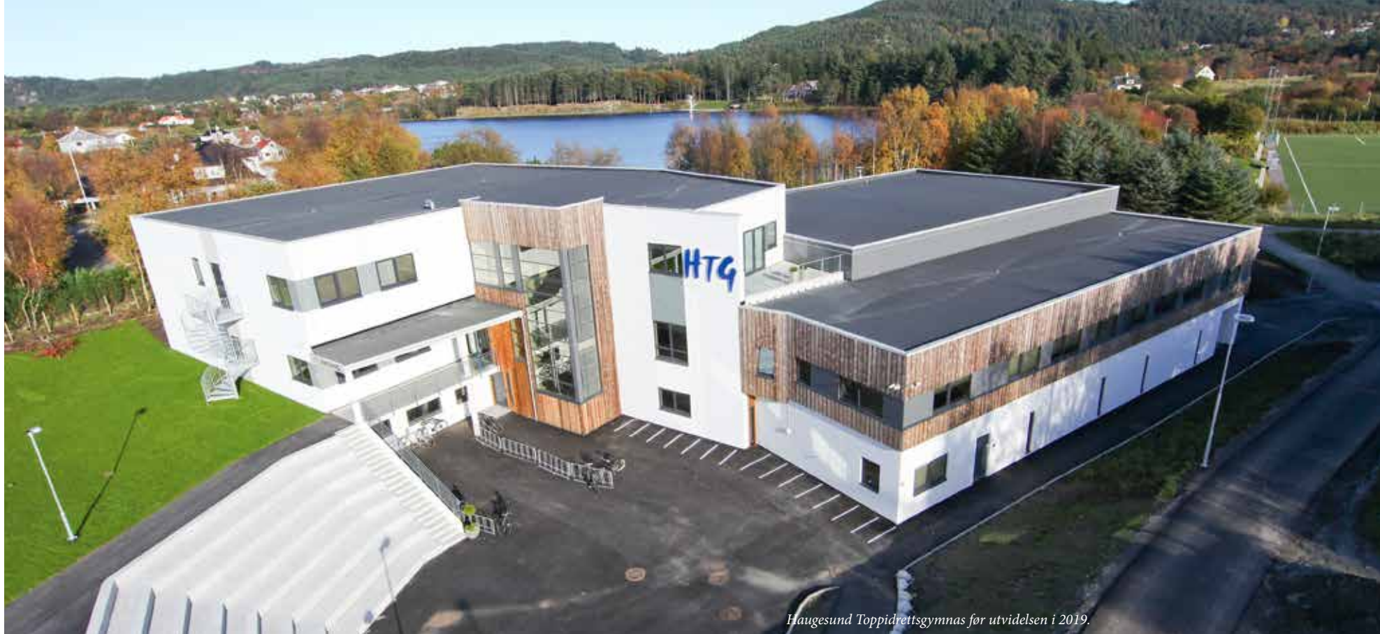
Haugesund Toppidrettsgymnas før utvidelsen i 2019.