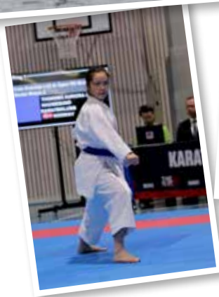
Haugesund Toppidrettsgymnas tilbyr tilrettelagt trening for over 20 ulike idretter.