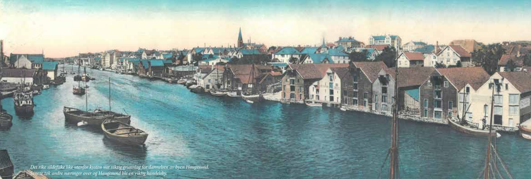
Det rike sildefiske like utenfor kysten var viktig grunnlag for dannelsen av byen Haugesund. Senere tok andre næringer over og Haugesund ble en viktig handelsby.