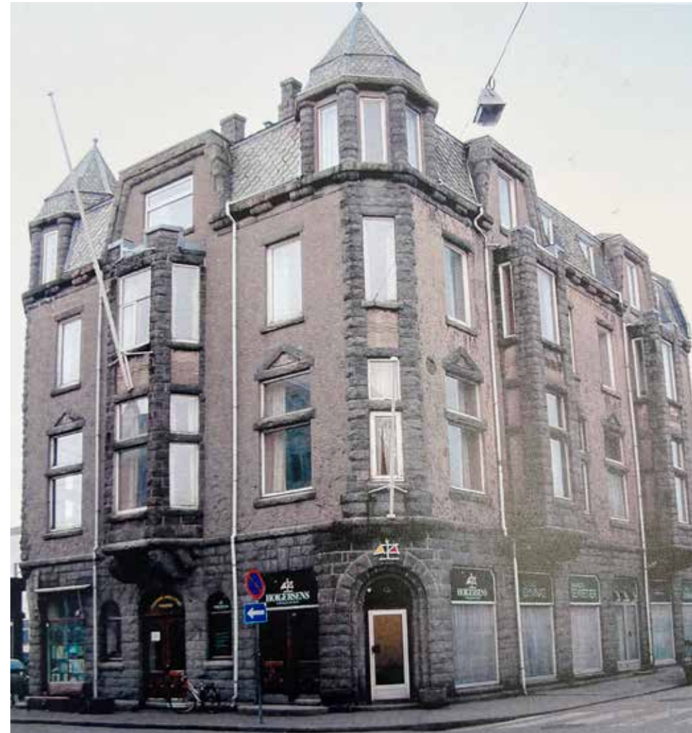
Holgersens Handelsskole holdt til i lokalene til Haugesund Handelsstandsforening i mange år.