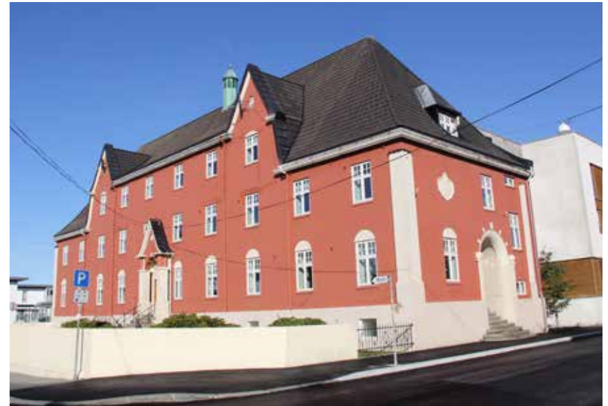
Fra april 1959 drev Holgersens Handelsskole undervisning i lokalene til Haugesund Barneheim sør i Haraldsgata.