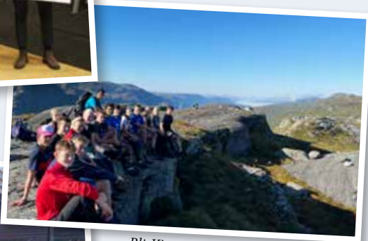
Bli-Kjent tur i Etnesfjellene med VG1.